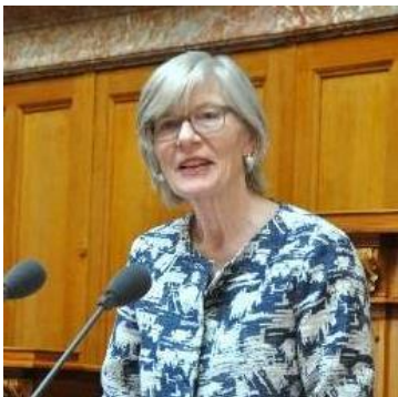
Regine Aepli Ehrenpräsidentin, Ehemalige Präsidentin SnB Ehemalige Bildungsdirektorin Kanton Zürich