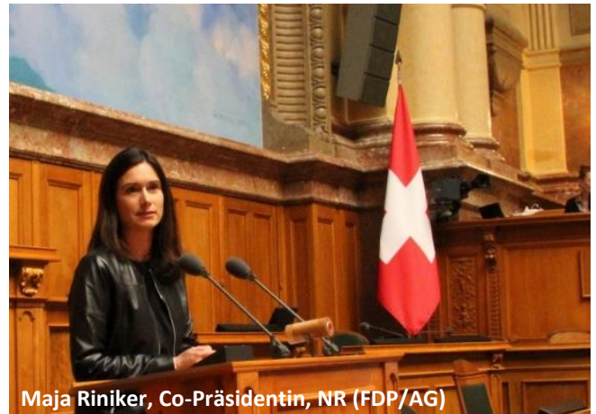
Maja Riniker, Co-Präsidentin, NR (FDP/AG)