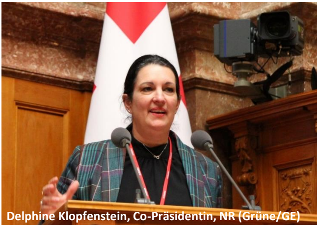
Delphine Klopfenstein, Co-Präsidentin, NR (Grüne/GE)