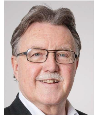
Synes Ernst Redaktor